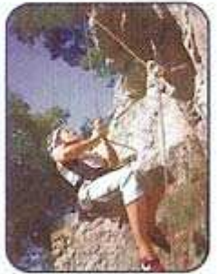
remontée au dernier point