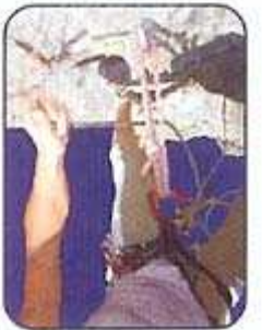
réchappe en paroi