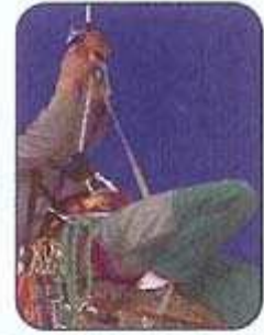
remontée sur corde